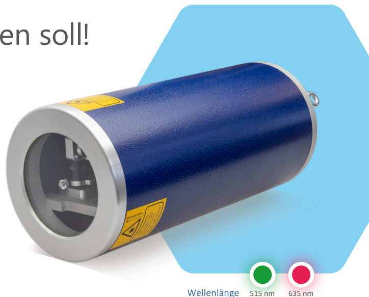
Wellenlänge 515 nm 635 nm

Als Beispiel können bei 1.000mm Distanz oder Einbauhöhe stufenlos Kreise von 270mm bis 1400mm Durchmesser erzeugt werden. Haupteinsatzgebiete für den ZKV sind der Fassbau oder die Produktion von Kabeltrommeln aus Holz. Schablonen werden überflüssig.